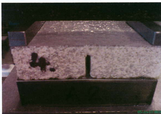
Ohyb na přípravku A2, překlenutí trhliny tloušťky 250 \mu m