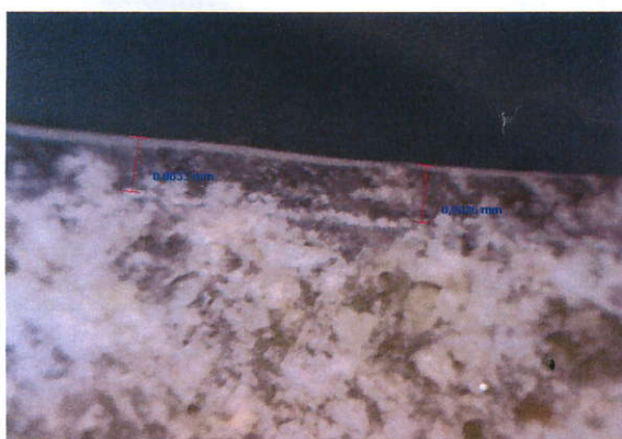
Měření tloušťky podlahoviny, stanovena 0,90 mm